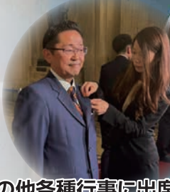
その他各種行事に出席 各種要望へ同行や説明等行っております。