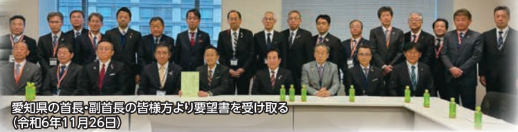
愛知県の首長・副首長の皆様方より要望書を受け取る (令和6年11月26日)