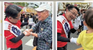
選挙期間中に、毎年参加している “春日井まつり”が開催されてい ました。