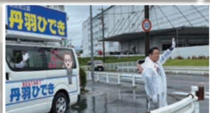
商業施設や駅前など、数十か所で お訴えをさせていただきました。 大きな音で、お騒がせいたしました。