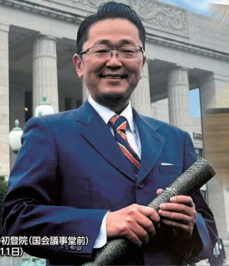
7期目当選後の初登院(国会議事堂前) (令和6年11月11日)