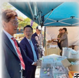
瀬戸市 秋の黨めぐり (令和6年11月9日)