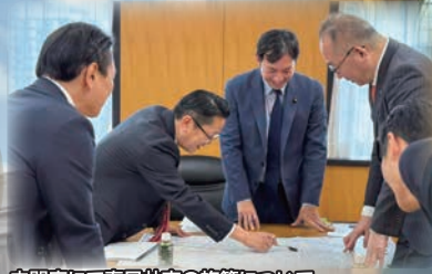
内閣府にて春日井市の施策について鳩山副大臣へ要望と説明 (令和6年12月5日)