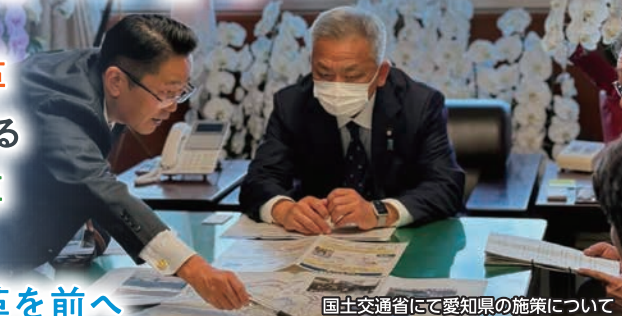
国土交通省にて愛知県の施策について高橋副大臣へ要望と説明 (令和6年11月26日)