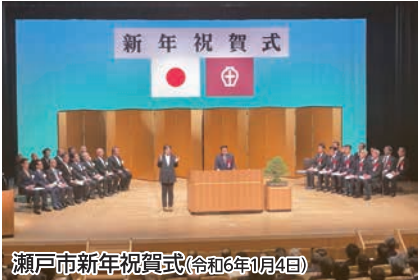
瀬戸市新年祝賀式(令和6年1月4日)