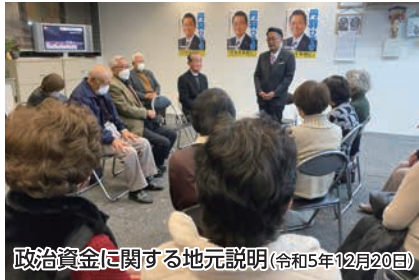
政治資金に関する地元説明(令和5年12月20日)