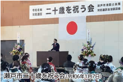
瀬戸市二十歳を祝う会(令和6年1月7日)