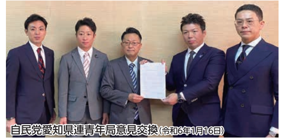
自民党愛知県連青年局意見交換(令和6年1月16日)