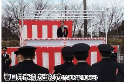
春日井市消防出初式(令和6年1月6日)